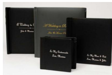
Tisk na desky